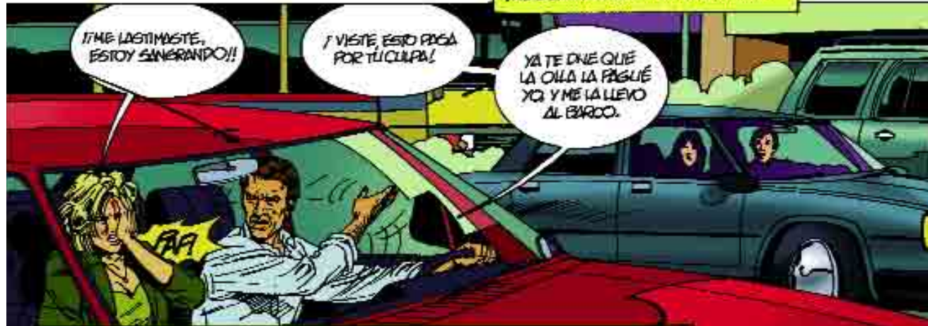
LOS SUPUESTOS MOTIVOS QUE PUEDEN DESENCADENAR LA VIOLENCIA SON TAN INTRASCENDENTES QUE NO MERECEAN SER TENIDOS EN CUENTA.