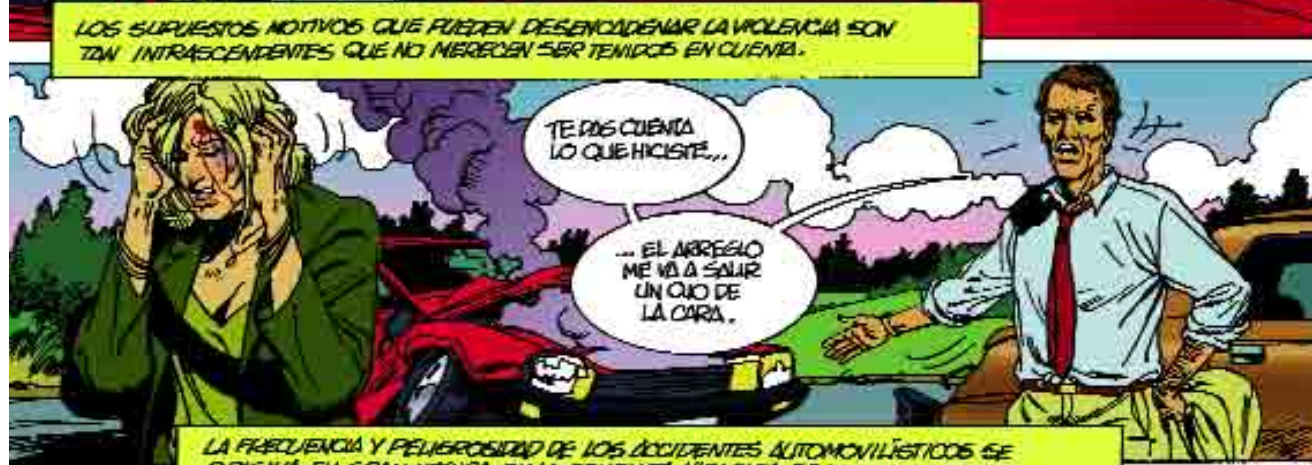
LA FRECUENCIA Y PELIGROSIDAD DE LOS ACCIDENTES AUTOMOVILÍSTICOS SE ORIGINA EN GRAN MEDIDA, EN LA CONDUCTA VIOLENTA DE LOS CONDUCTORES.