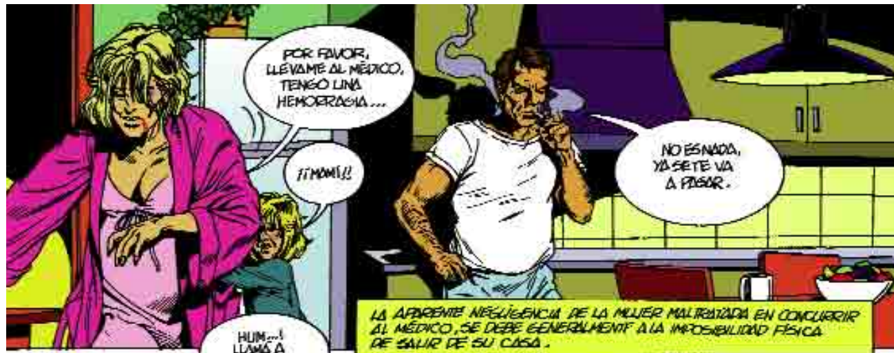
LA APARENTE NEGLIGENCIA DE LA MUJER MALTRATADA EN CONCURRIR AL MÉDICO, SE DEBE GENERALMENTE A LA IMPOSIBILIDAD FÍSICA DE SALIR DE SU CASA.