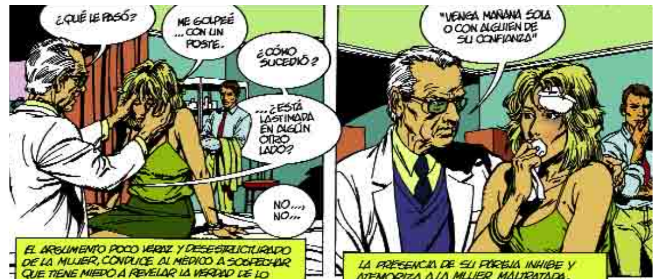
EL ARGUMENTO POCO VERAZ Y DESESTRUCTURADO DE LA MUJER, CONDUCE AL MÉDICO A SOSPECHAR QUE TIENE MIEDO A REVELAR LA VERDAD DE LO SUCEDIDO.