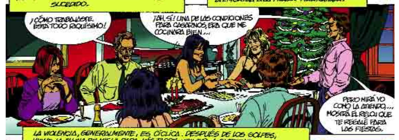
LA VIOLENCIA, GENERALMENTE, ES CÍCLICA. DESPUÉS DE LOS GOLPES, VIENE LA "LUNA DE MIEL" PARA, MÁS TARDE, VOLVER A EMPEZAR.