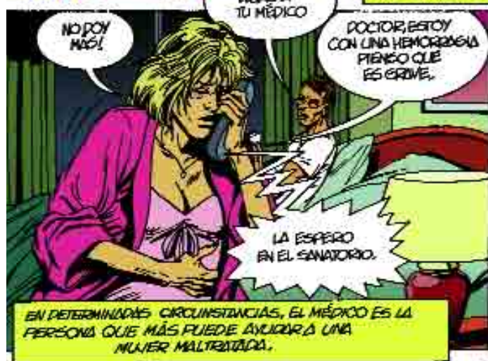
EN DETERMINADAS CIRCUNSTANCIAS, EL MÉDICO ES LA PERSONA QUE MÁS PUEDE AYUDAR A UNA MUJER MALTRATADA.