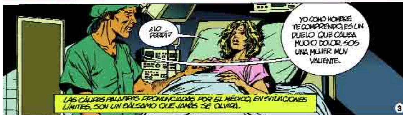
LAS CÁLIDAS PALABRAS PRONUNCIADAS POR EL MÉDICO, EN SITUACIONES LÍMITES, SON UN BÁLSAMO QUE JAMÁS SE OLVIDA.

177. OBLIGACION DE DENUNCIAR. TENDRAN OBLIGACION DE DENUNCIAR LOS DELITOS PERSEGUIBLES DE OFICIO 1º LOS FUNCIONARIOS O EMPLEADOS PUBLICOS QUE LOS CONOZCAN EN EL EJERCICIO DE SUS FUNCIONES 2º LOS MEDICOS, PARTIRAS, FARMACEUTICOS, Y DEMAS PERSONAS QUE EJERCEN CUALQUIER ARTE DE CURAR. EN CUANTO A LOS DELITOS CONTRA LA VIDA Y LA INTEGRIDAD FISICA QUE CONOZCAN AL PRESTAR LOS PRIMEROS AUXILIOS DE SU PROFESION, SALVO QUE LOS HECHOS CONOCIDOS ESTEN BAJO EL AMPLIO DEL SECRETO PROFESIONAL. CODIGO DE PROCEDIMIENTO PENAL LIBRO II INSTRUCCION. TITULO I. CAP. I DENUNCIA