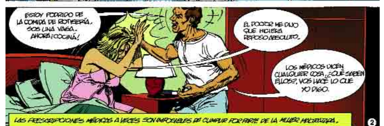
LAS PRESCRIPCIONES MÉDICAS A VECES SON IMPOSIBLES DE CUMPLIR POR PARTE DE LA MUJER MALTRATADA.