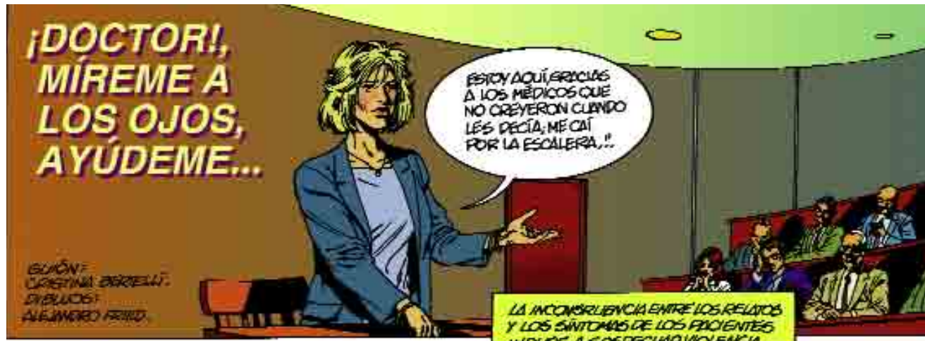
LA INCONGRUENCIA ENTRE LOS RELATOS Y LOS SÍNTOMAS DE LOS PACIENTES INDUCE A SOSPECHAR VIOLENCIA.