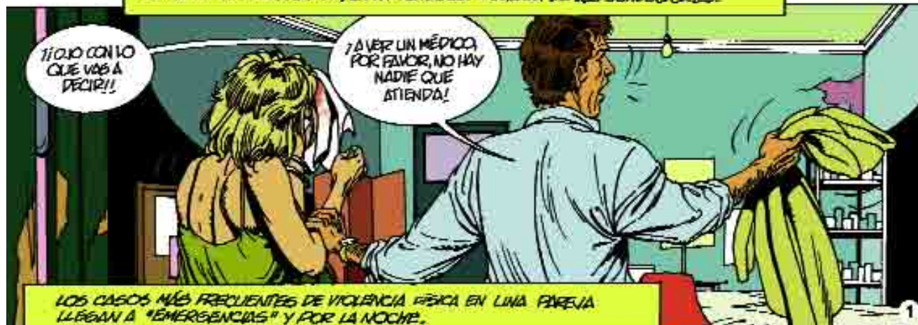
LOS CASOS MÁS FRECUENTES DE VIOLENCIA FÍSICA EN UNA PAREJA LLEGAN A "EMERGENCIAS" Y POR LA NOCHE.